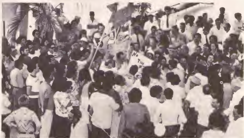
Na regreso di e delegacion Arubano for di Hulanda ariba 16 di September un multitud grandi a presenta na aeropuerto pa duna e miembronan di e delegacion un caluroso bonbini di un viahe di exito, pero cu reservas.